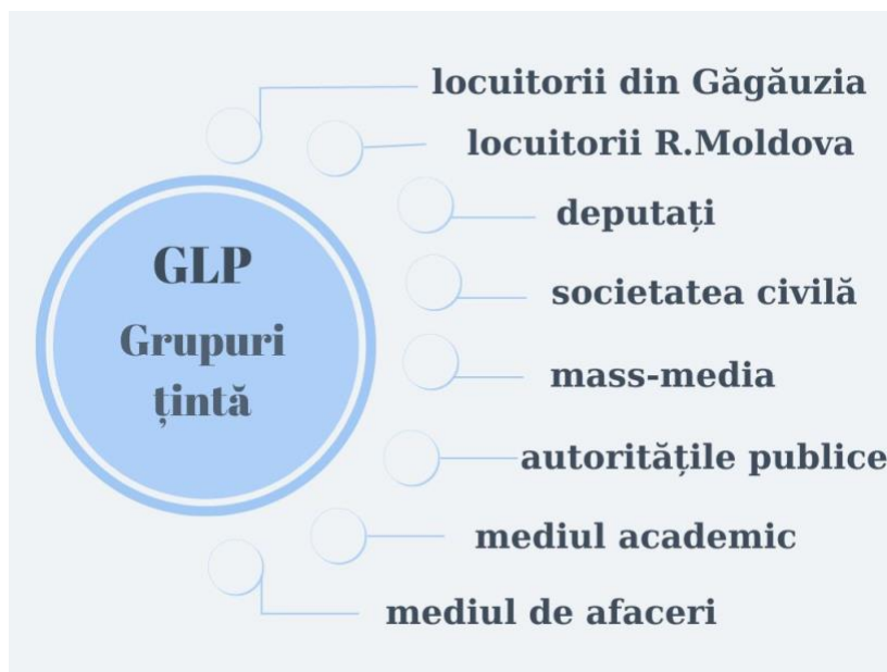
Grupuri țintă pentru GLP

contextul reformei de descentralizare a administrației publice locale drept o cerință impusă de Comisia Europeană. Mai mult decât atât, auditul a demonstrat disponibilitatea membrilor Parlamentului de a aborda subiectul și de a lansa un dialog cu diverși actori. Evident, este necesară o comunicare mai intensă cu mass-media, organizații nonguvernamentale (ONG), lideri de opinie, reprezentanți ai mediului academic, membrii Guvernului, administrația publică locală, mediul de afaceri și cu simplii cetățeni.