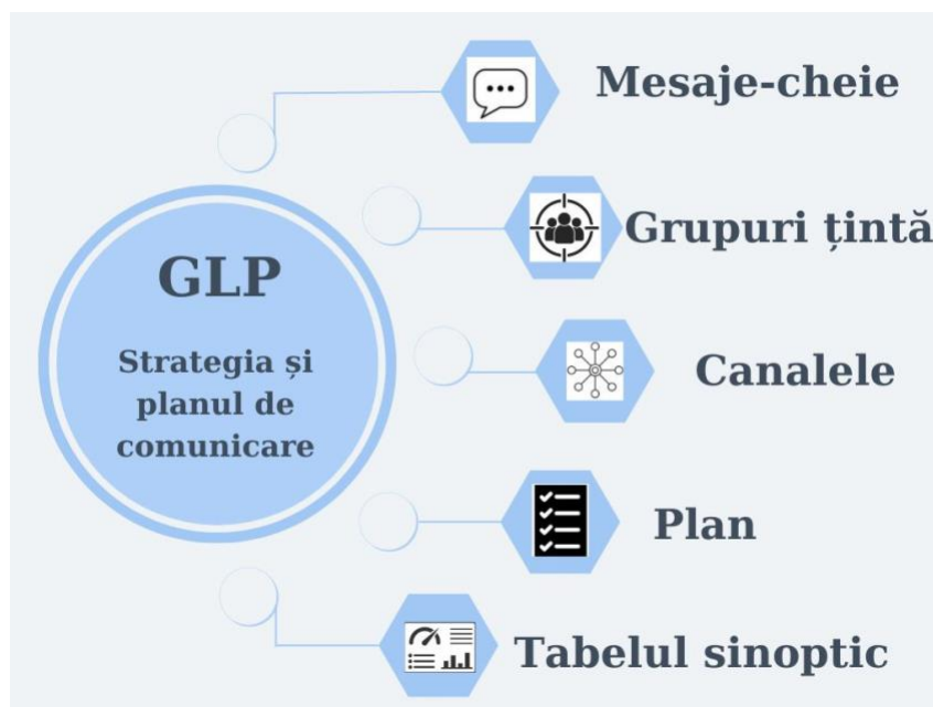
Strategia și Planul de comunicare

Prezentul document a fost elaborat pentru Grupul de lucru parlamentar privind Găgăuzia la solicitarea CMI - Fundația pentru pace Martti Ahtisaari cu sprijinul financiar din partea Suediei. Strategia de comunicare reflectă opiniile exprimate în cadrul Auditului privind comunicarea, venind cu un șir de propuneri privind mesajele, canalele și instrumentele cele mai potrivite pentru comunicarea în cadrul GLP. De asemenea, este urmărit obiectivul de îmbunătățire a practicilor de comunicare a GLP în cadrul instituțiilor publice, dar și în afara acestora (cu publicul general, cu grupuri mai largi de actori etc.), punând pe seama secretariatului GLP gestionarea eficientă a comunicărilor.