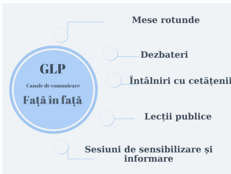
Instrumente recomandate pentru comunicarea GLP în format față-în-față