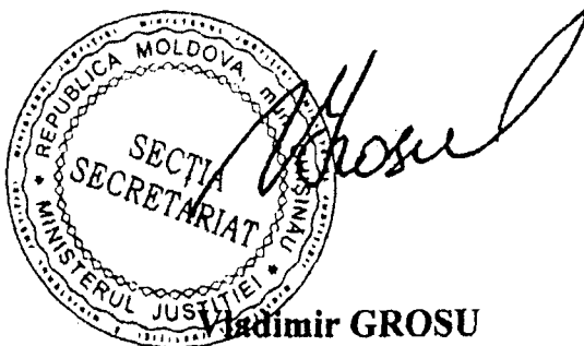
Vladimir GROSU Viceministru

8. În egală măsură, se va revedea anexa la Acordul de finanțare, prin excluderea din pct. 1 lit. (a) a cuvintelor “sau Banca” și substituirea cuvintelor “au convenit” cu cuvintele “a convenit”, precum și prin definirea în pct. 2 a noțiunii “Acord de finanțare”.